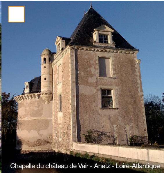
Chapelle du château de Vair - Anetz - Loire-Atlantique